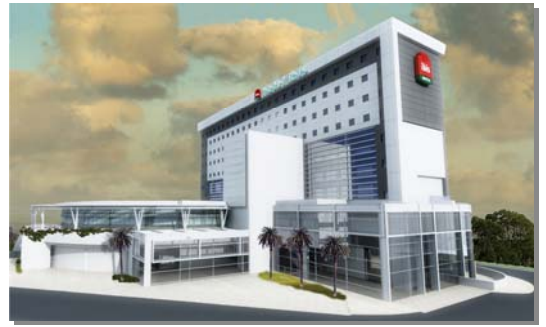
Ibis Cancún Centro