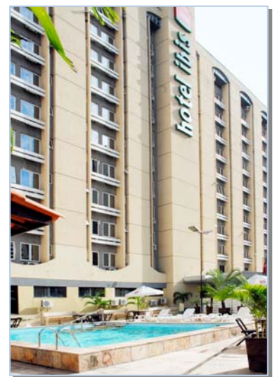
ibis Fortaleza Praia Brésil