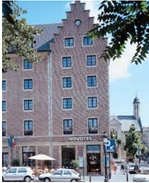
Novotel Brussels Off Grand'Place: - 30%