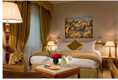
MGallery Cerretani Firenze:- 30%