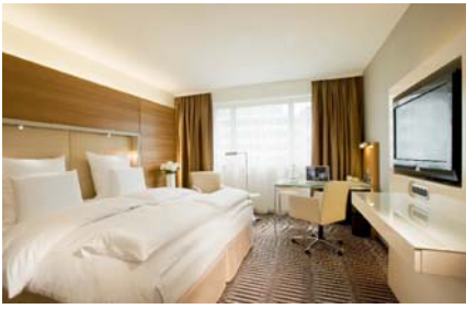
Pullman Berlin Schweizerhof :- 50%