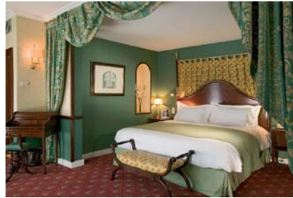
Mercure Madrid Plaza de España: -20%