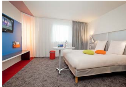
all seasons Paris Bercy: - 30%