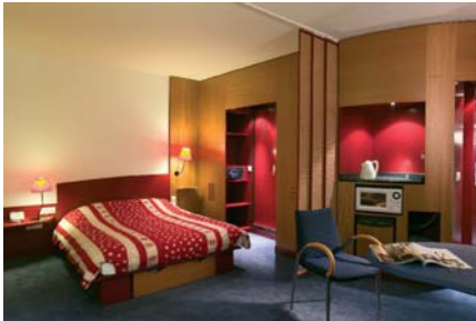
Suitehotel Genève: - 30%