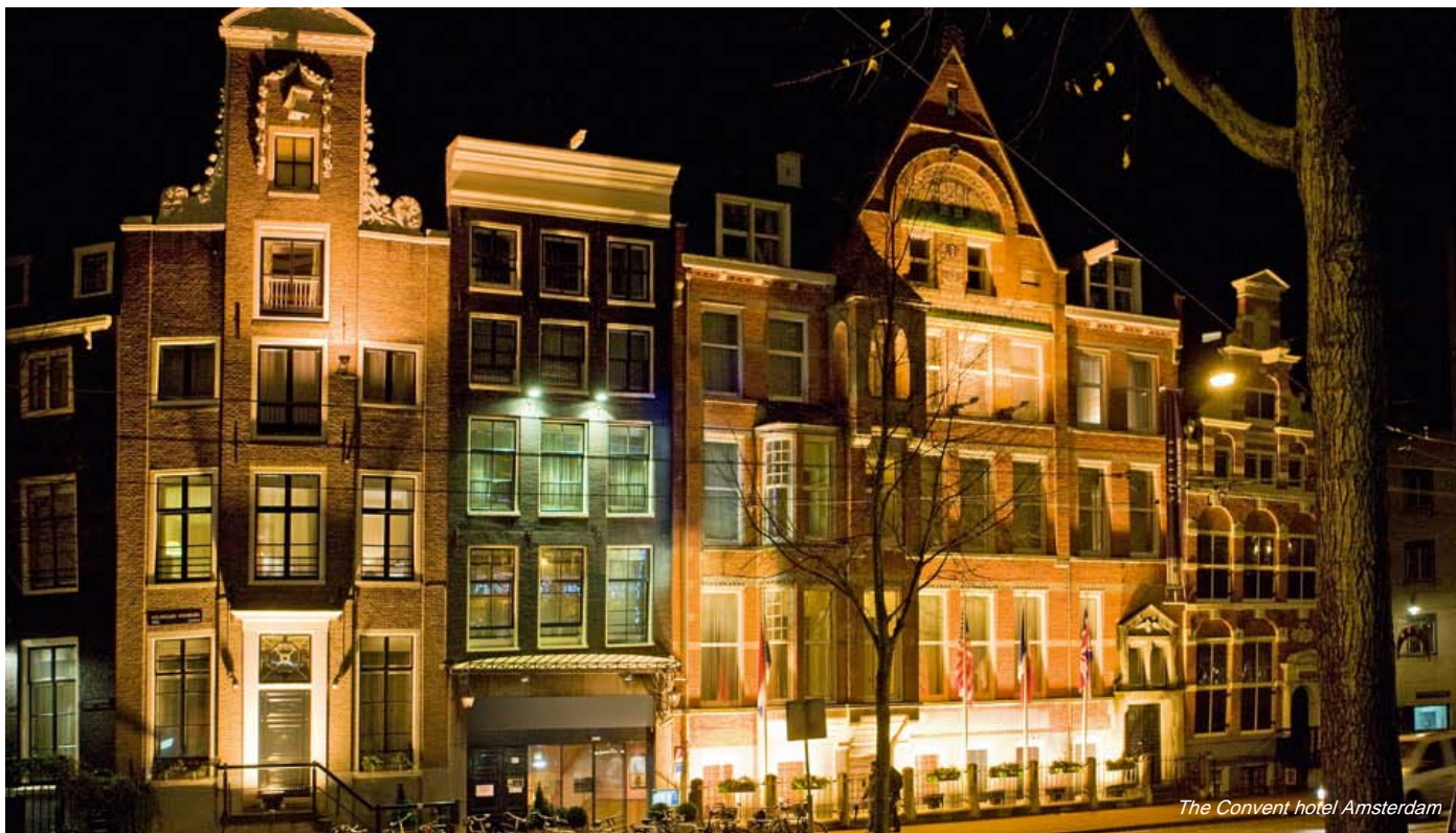
The Convent hotel Amsterdam

Les hôtels de la collection MGallery proposent à leurs hôtes de vivre une expérience de séjour distinctive en harmonie avec leur identité et leur environnement. Pour prolonger cette expérience, ces hôtels proposent deux offres originales qui invitent le voyageur à mieux appréhender la singularité de son hôtel et découvrir la richesse culturelle, gastronomique ou encore patrimoniale de son lieu de villégiature.