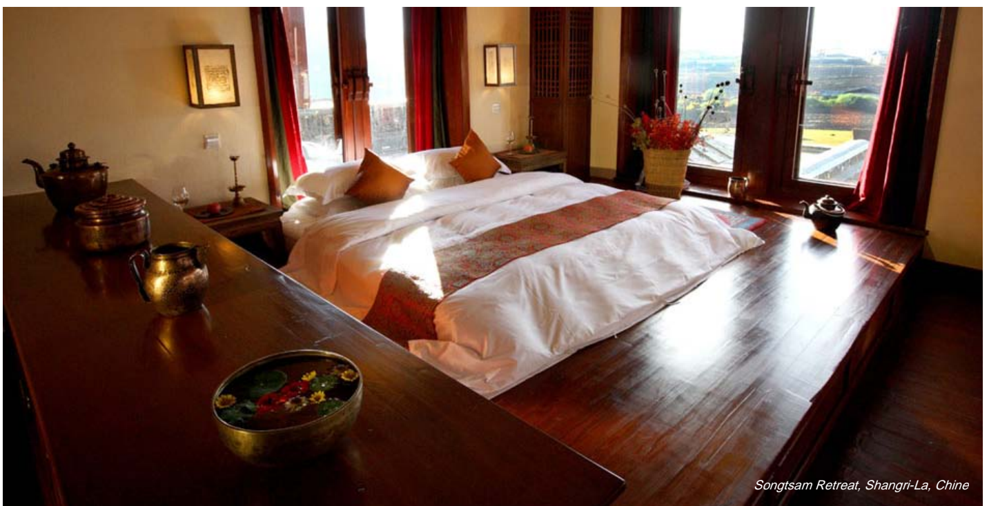
Songtsam Retreat, Shangri-La, Chine

Dans les hôtels de la collection MGallery, la salle de bains est naturellement un lieu d'expérience sensorielle dédié aux soins du corps. Équipée d'une douche ou d'une large baignoire au choix selon les désirs du client, elle répond ainsi aux attentes des hôtes amateurs de réveils toniques et énergisant tout en satisfaisant les inconditionnels des longs bains chauds et parfumés. L'hôte trouvera à sa disposition une ligne de produits d'accueil de grande qualité et l'invitant à une expérience polysensorielle de relaxation après une journée de visites et de promenades.