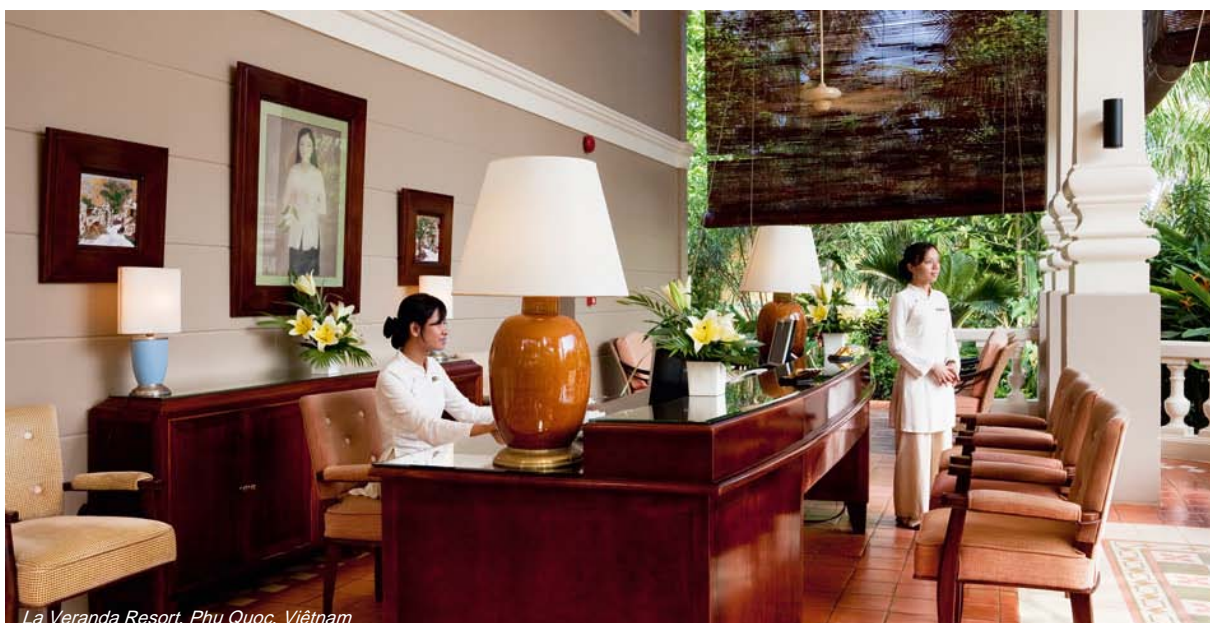
La Veranda Resort, Phu Quoc, Vietnam