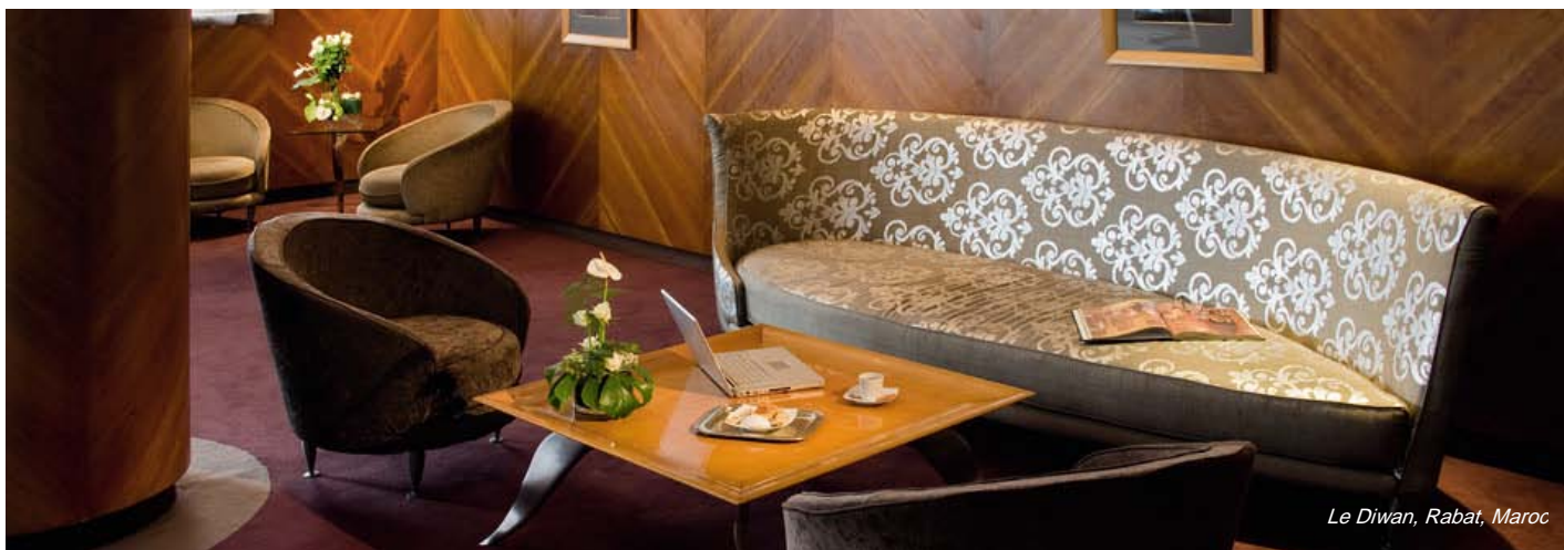
Le Diwan, Rabat, Maroc

Profiter de soins du corps dans les effluves de roses et de fleur d'oranger avant de déguster des pâtisseries marocaines dans la mezzanine du Diwan ; prendre le temps de savourer au lit un « Grand petit déjeuner » dans une chambre du Royal Lyon dont la décoration évoque l'élégance discrète des maisons bourgeoises lyonnaises... Saveurs, parfums, instants de plaisir, esprit des lieux, tous ces détails s'orchestrent et s'harmonisent pour faire vivre au voyageur une expérience de séjour authentique et distinctive.