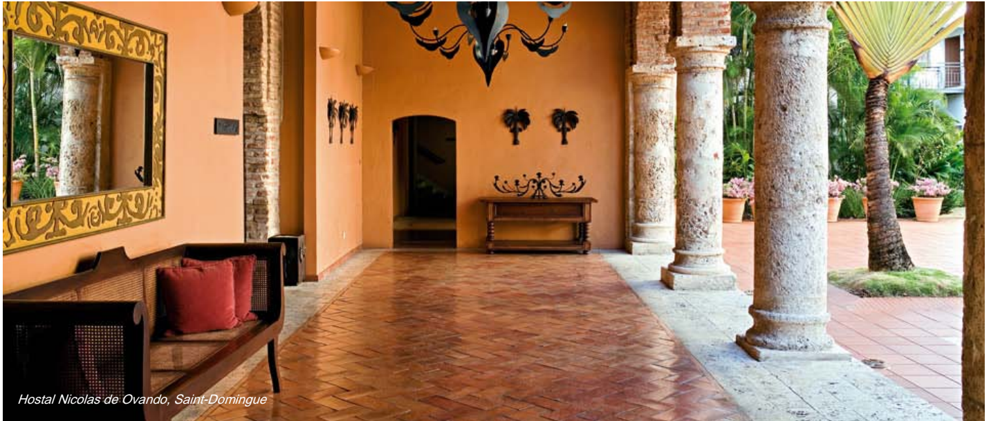
Hostal Nicolas de Ovando, Saint-Domingue

À peine franchie la porte d'entrée, le voyageur est invité à s'imprégner de l'histoire de l'hôtel et à faire de son séjour une expérience authentique. Ainsi, agencement des espaces, décoration, parfums d'ambiance, identité visuelle, bibelots précieux ou objets inattendus, offre de services, tout se veut en cohérence avec l'histoire et l'identité de chaque établissement. Cet « esprit des lieux » est la marque des hôtels de la collection MGallery et participe pleinement à l'expérience de séjour.