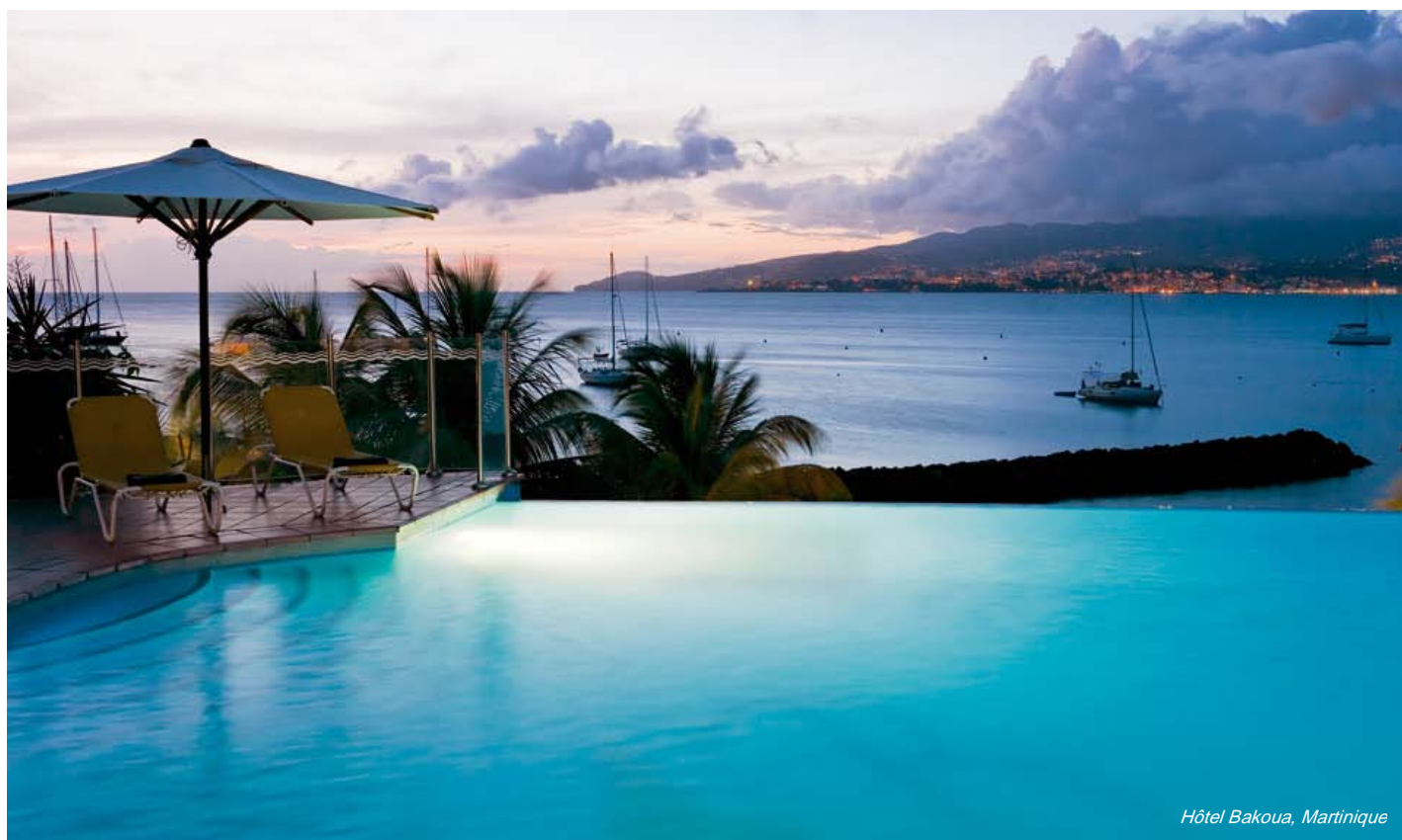
Hôtel Bakoua, Martinique

La collection MGallery poursuivra ainsi son développement à l'international afin de proposer aux voyageurs, avides de découvertes et de nouveautés, un éventail de destination encore plus large. ►►