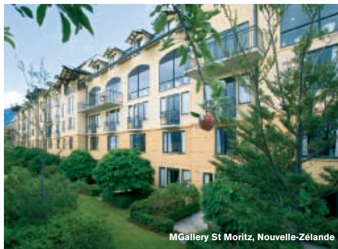
MGallery St Moritz, Nouvelle-Zélande