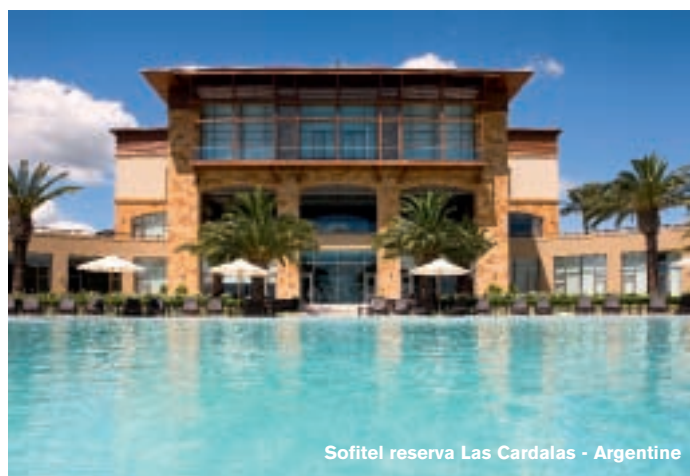
Sofitel reserva Las Cardalas - Argentine