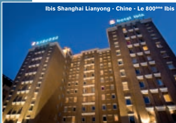
Ibis Shanghai Lianyong - Chine - Le 800 ème Ibis