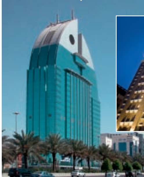
Novotel Al Anoud - Riyadh - Arabie Saoudite